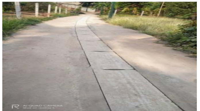
(รางระบายน้ำคอนกรีตเสริมเหล็ก ถนนชิตวารี ๖)