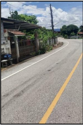
(ถนนชิตวารี ๖ (ช่วงที่๑))