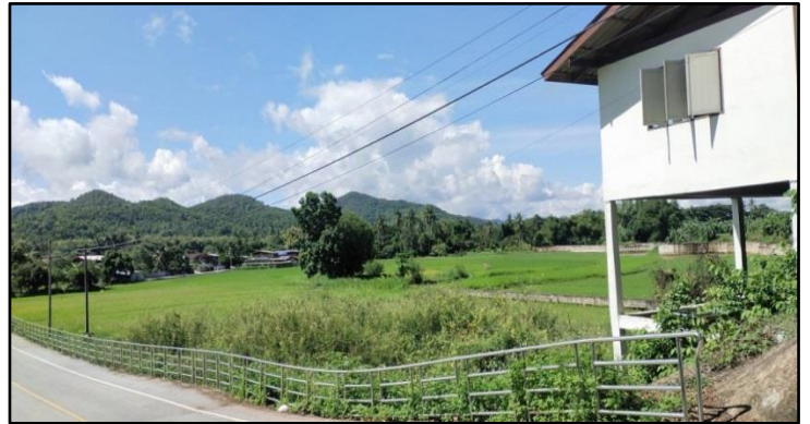
(ก่อสร้างลำเหมืองไหล่ทางคอนกรีตเสริมเหล็กบ้านบุง)